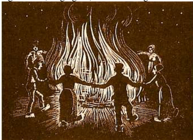
Wilde dans om Sint Jansvuur – houtsnede van Jan Boon

Voor de heidense boeren is Midzomer het punt waarbij niet meer voorbereidend werk op de akkers gedaan wordt, maar is het wachten op en beschermen van de oogst. In de komende maanden zal blijken of in de voorbereiding (zaaien, bemesten enz) de juiste keuzes gemaakt zijn. Dat wat gezaaid en onderhouden is, moet nu afrijpen. Met Midzomer begint de eindfase van alles dat eerder gepland was. Nu beginnen de resultaten zichtbaar te worden van alle noeste arbeid. Het Lot bepaalt hoe vol de oogst zal zijn. We kunnen terug schouwen, en overwegen wat we goed of wat verkeerd gedaan hebben, en nu is het moment gekomen om de Goden te vragen de afrijping gunstig te laten verlopen. Vooral het bieden van bescherming tegen storm, slagregens, onweer en hagel.