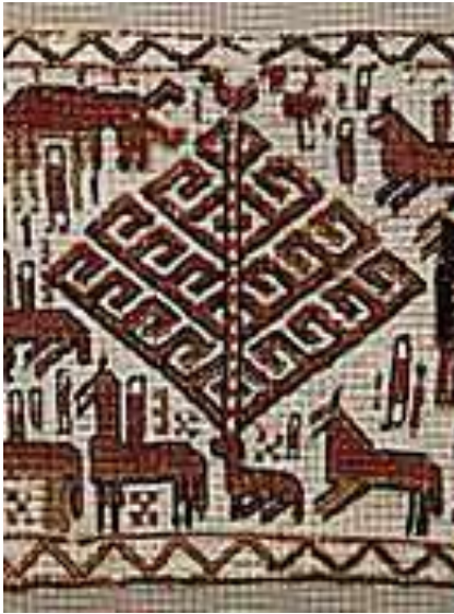
Wereldboom (Yggdrasil) met een haan in de top; detail van het Överhogdal wandtapijt uit Zweden. Dateert tussen 800 en 1000 n.o.j.

Als de cirkel geheiligd is, kan de band met de Goddelijke wereld hersteld worden, door op het moment van de middag (het moment dat de Zon op zijn hoogste punt aan de hemel staat) de midzomerstaak op te richten. De verbinding met Freyr, Freyja en Balder is nu tot stand gebracht. Dan is het moment om de overleden voorouders bij het ritueel te betrekken. Dit kan door een met midzomerbloemen beklede lege stoel in de cirkel te plaatsen. Een offer kan aan Freyr en Freyja gebracht worden, waarbij om vrede en vruchtbaarheid verzocht wordt. Daarna kan de “koningsvogel” de haan boven op de midzomerstaak afgeschoten worden. De haan staat symbool voor de zon, en heeft op de middag op midzomer zijn hoogste punt bereikt. En wat “boven geschiedt, moet ook hier beneden geschieden”; de haan als symbool voor de zon, moet sterven om opnieuw geboren te kunnen worden. Tegenwoordig gebeurt dit nog door de Koning van het schuttersgilde die tijdens midzomer de Koningsvogel neerhaalt.