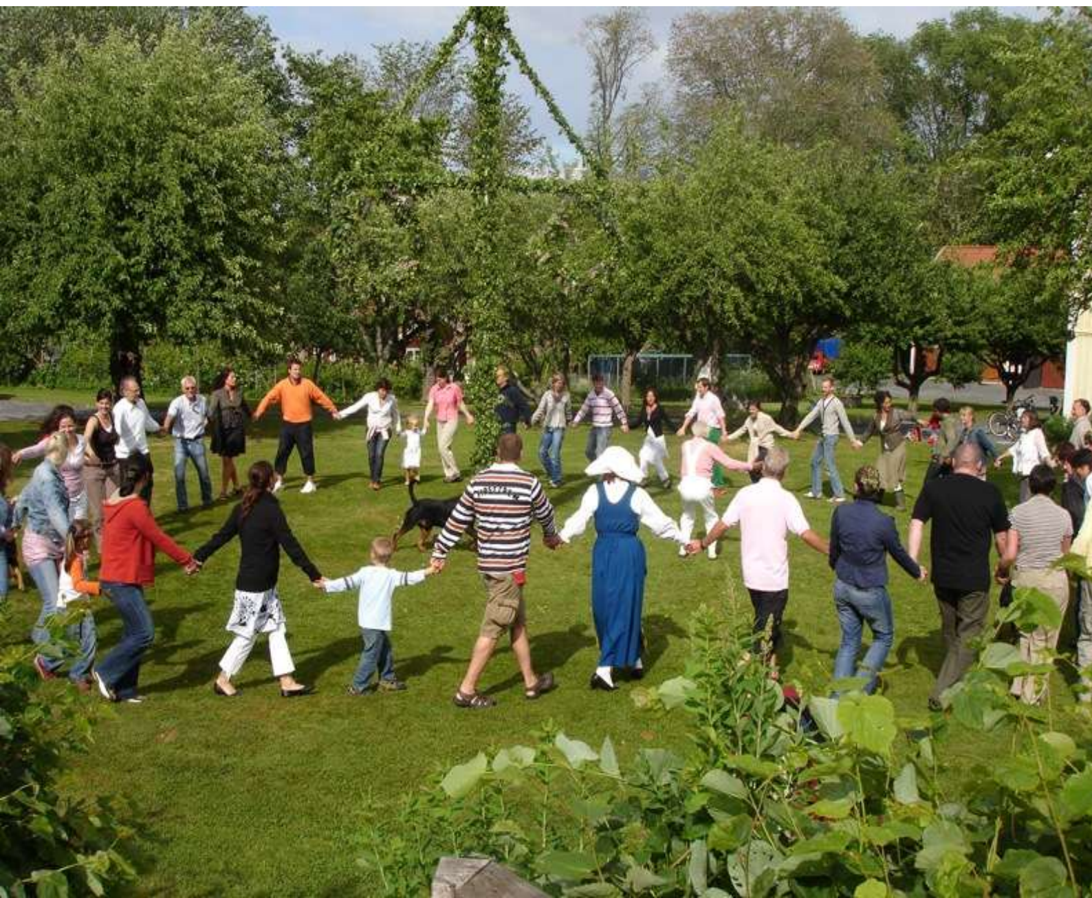
Midsommarfeest in Zweden

In Nederland is het volksfeest van Sint Jan bijna een stille dood gestorven. In enkele Brabantse dorpen wordt het nog gevierd. Daarnaast wordt op vrije scholen en door paganistische groeperingen het Midzomerfeest opnieuw gevierd. We kunnen hierbij spreken van neofolklore. In de jaren dertig hebben volkskundigen nog wel een poging gedaan het feest te reanimeren, echter zonder veel succes. In andere delen van Europa (Scandinavië, de Baltische- en Slavische landen) is het Midzomerfeest nog een levende traditie. In de plattelandsgebieden van Zweden en in grote delen van de Alpen, zeg maar de perifere plekken waar het Germaanse heidendom het langste stand hield, is het midzomerfeest nog steeds een levendig volksfeest. In Zweden is de "Midsommar" een van de populairste seizoensfeesten.