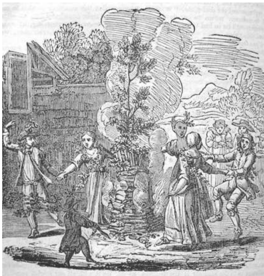
Gravure van Midzomerfeest in Frankrijk