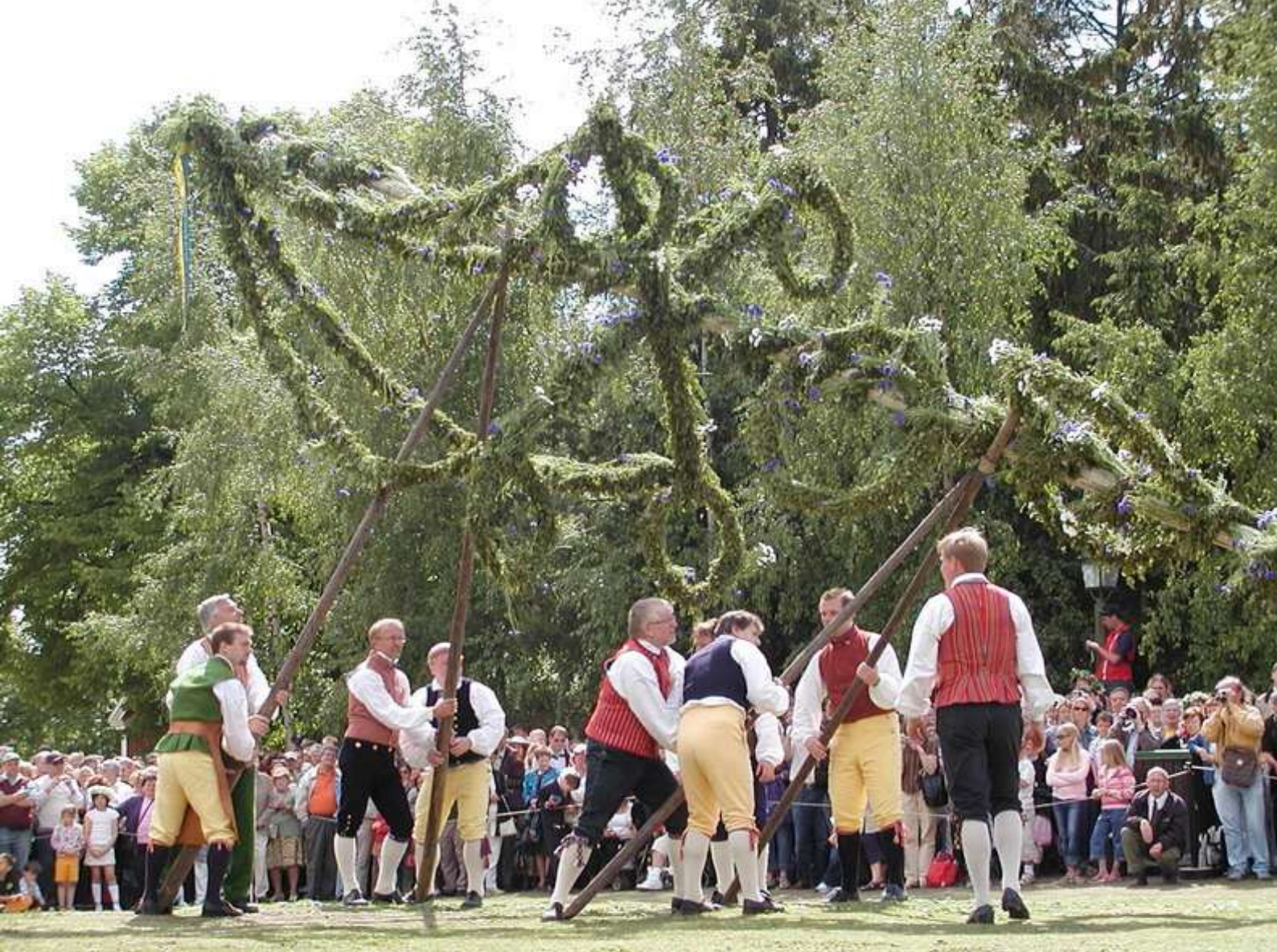
Oprichten midzomerstang in Zweden